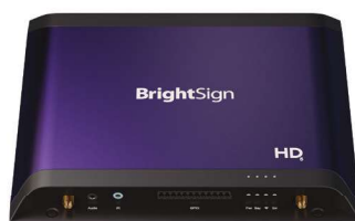
Paquete de E/S estándar