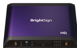
Paquete de E/S ampliado