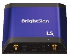
Paquete E/S Básico HD