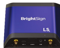
Paquete E/S Básico 4K