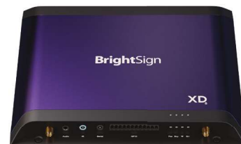
Paquete de E/S ampliado