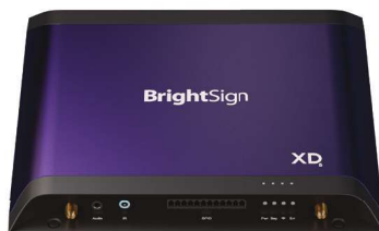
Paquete de E/S estándar